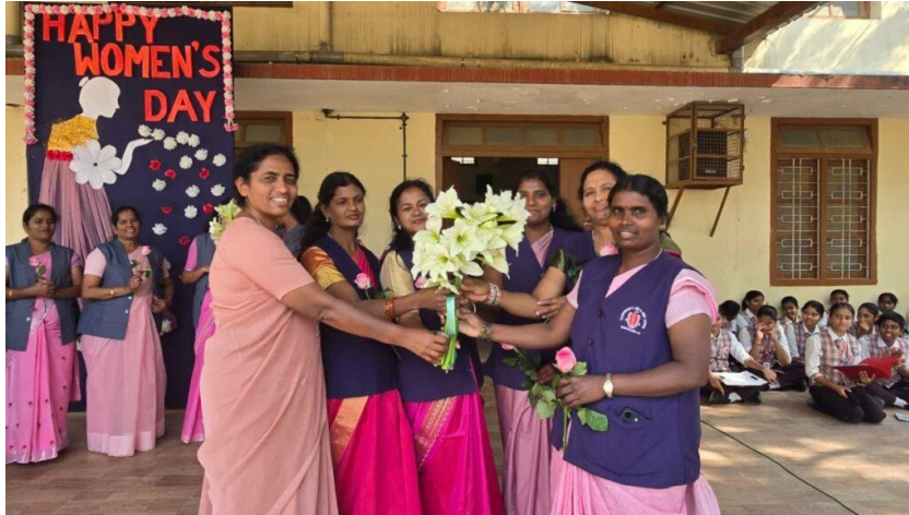
Schülerinnen und Mitarbeiter feiern an der St. Euphrasia's Girls High School in Bangalore, Indien